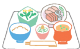
栄養バランスの良い食事

口内炎で最も一般的なアフタ性口内炎は、確かな原因はわかりませんが、からだの免疫力が低下した時に、口の中の細菌によって引き起こされたり、胃腸などの内臓障害が主な原因と考えられています。予防法としては、栄養バランスの整った食事を心がける。睡眠をしっかりととり、ストレスを溜めない。普段から正しいブラッシングを心がけ、お口の中を清潔に保つなどが大切です。